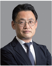
代表取締役 最高経営責任者

「総合補償コンサルタント」として「国土の安全・発展」と「公共の福祉の増進」に寄与します。